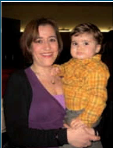
Visita de los Reyes Magos