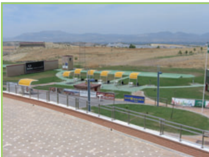
Instalaciones del Campo de Tiro de las Gabias donde se celebró el torneo.