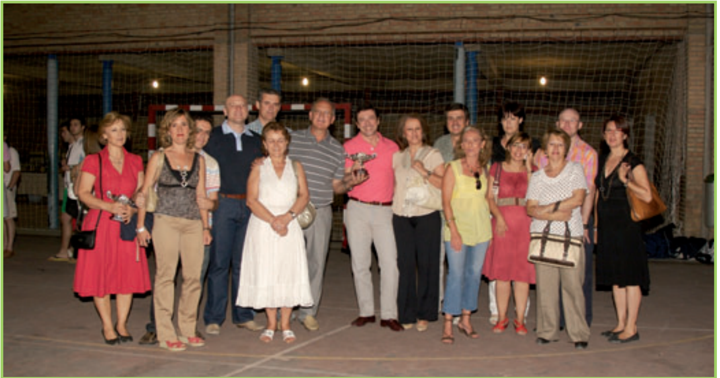
Peña La Andarina