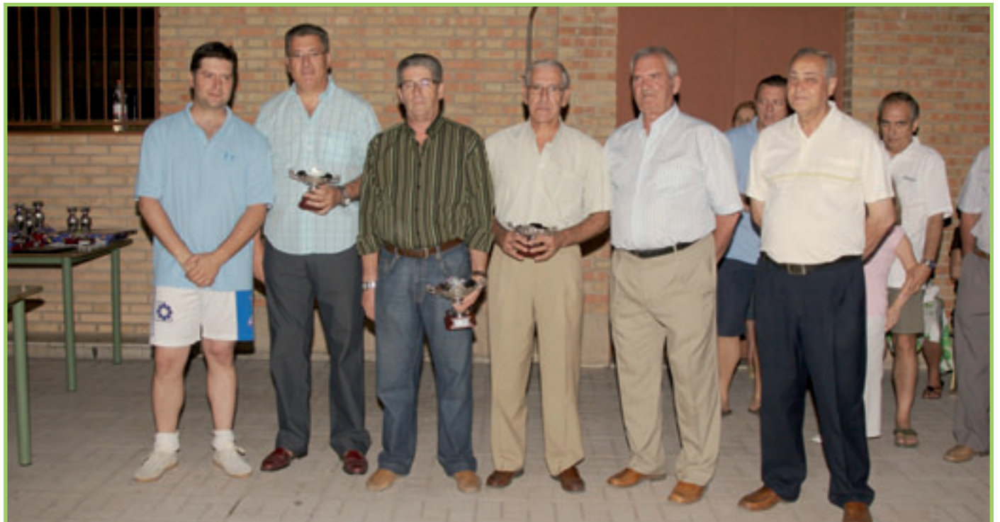
Equipo Intercajas Torneo CORPUS