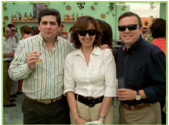
Distintos compañeros en la Feria del CORPUS