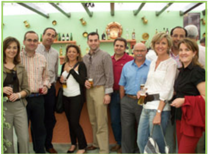
Asesoría Jurídica y Órgano de Gobierno