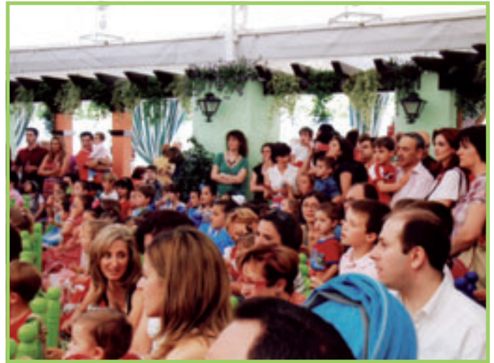
Fiesta Infantil. Caseta Feria