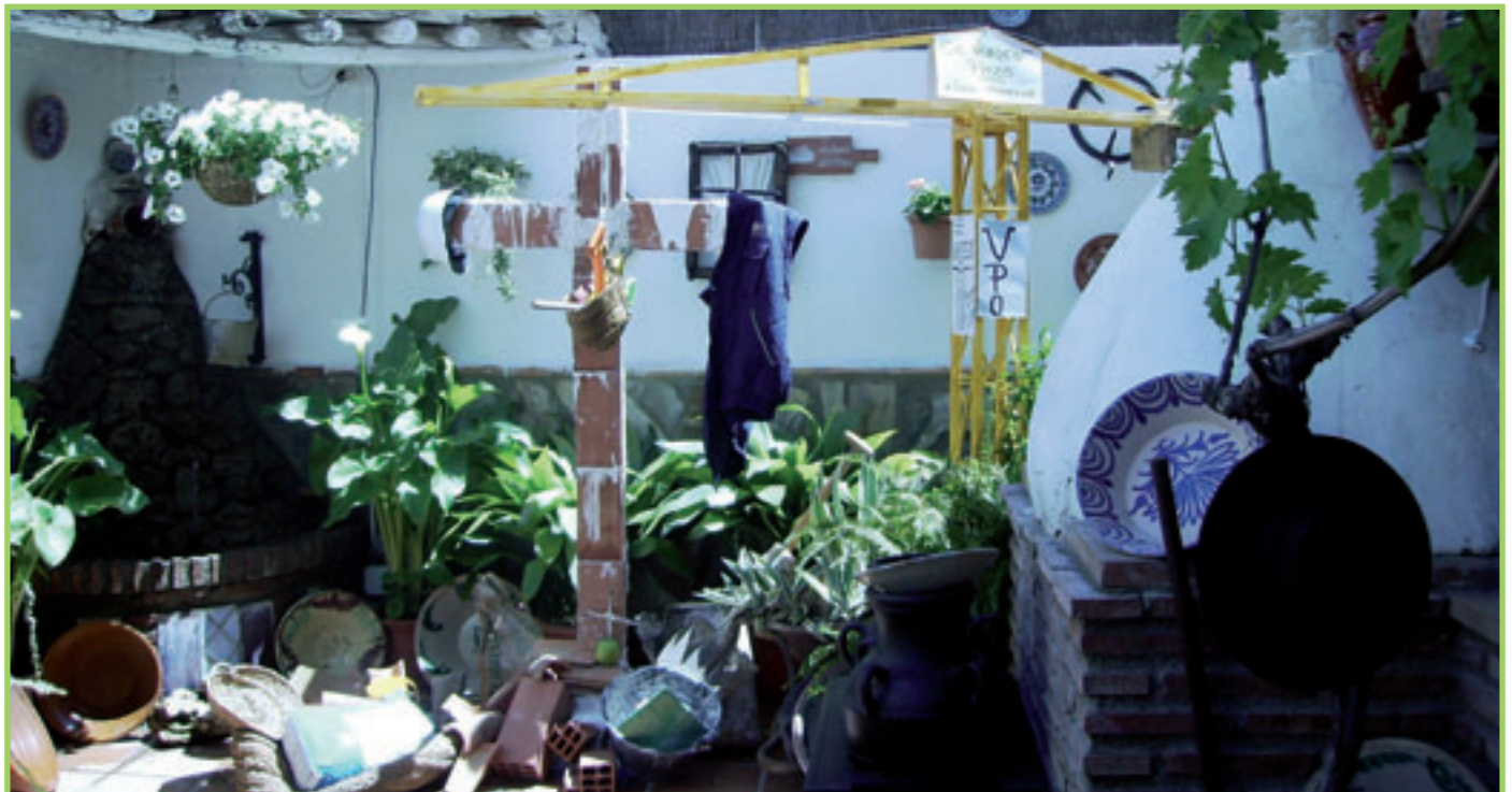
Cruz del Carmelo por Jesús García Guillén