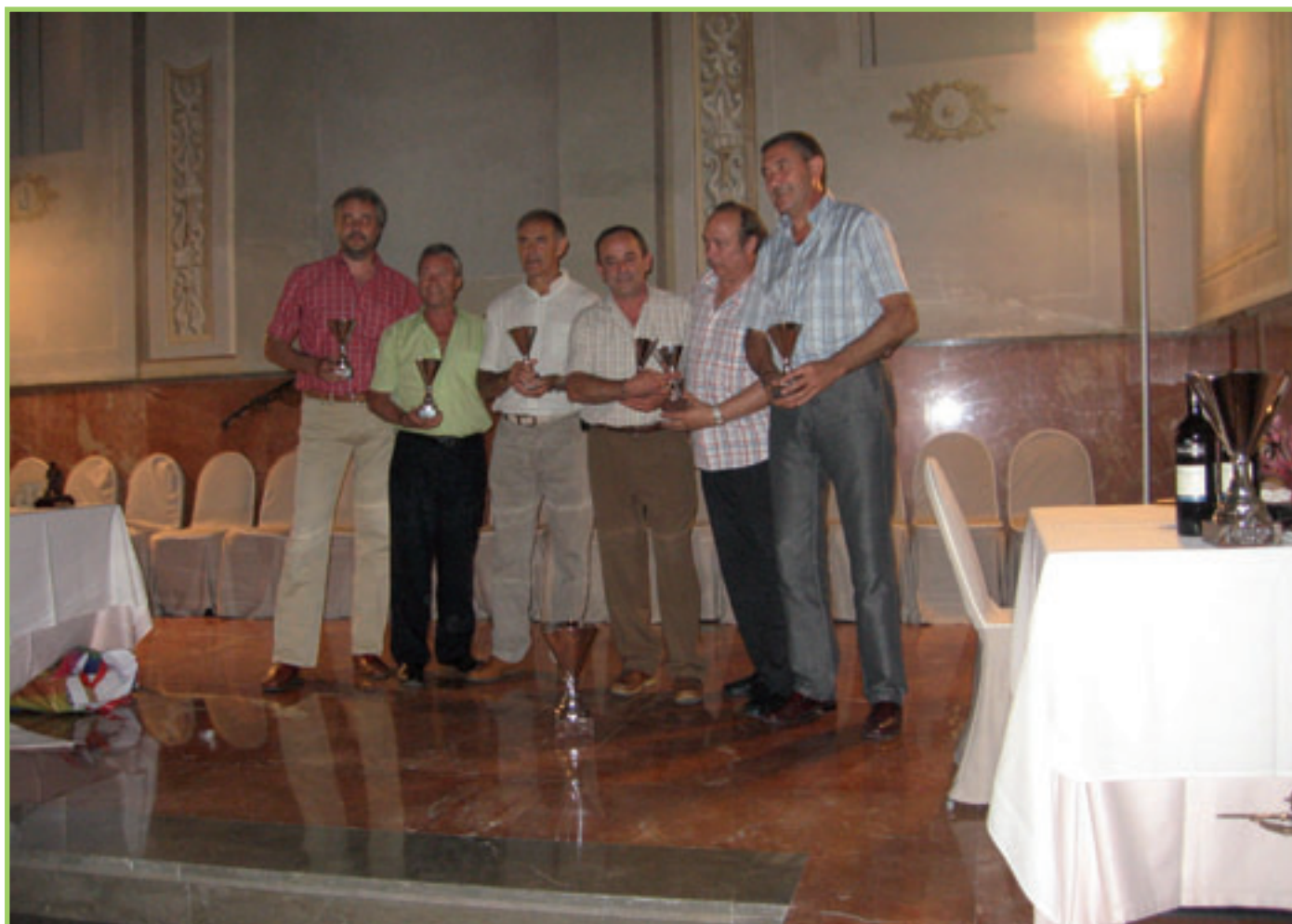
Entrega de Premios en Cena de Clausura. (Hotel Sta. Paula)

Este año el XXIV Campeonato Intercajas de Tiro al Plato, se ha celebrado en Granada, siendo esta la tercera vez en su historia que la Asociación organiza en nuestra zona este evento.