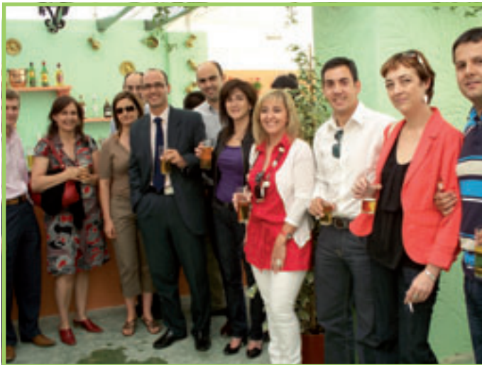
Promoción y Publicidad