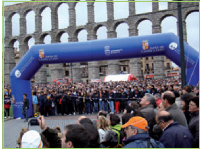
Salida carrera desde Acueducto de Segovia