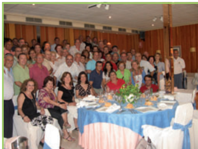
Participantes Torneo Tiro al Plato.

Como no iba a ser de otra forma este año que nos ha tocado como anfitriones, lo celebramos en el campo mencionado quedando los asistentes sorprendidos gratamente por las magnificas instalaciones que disponemos.