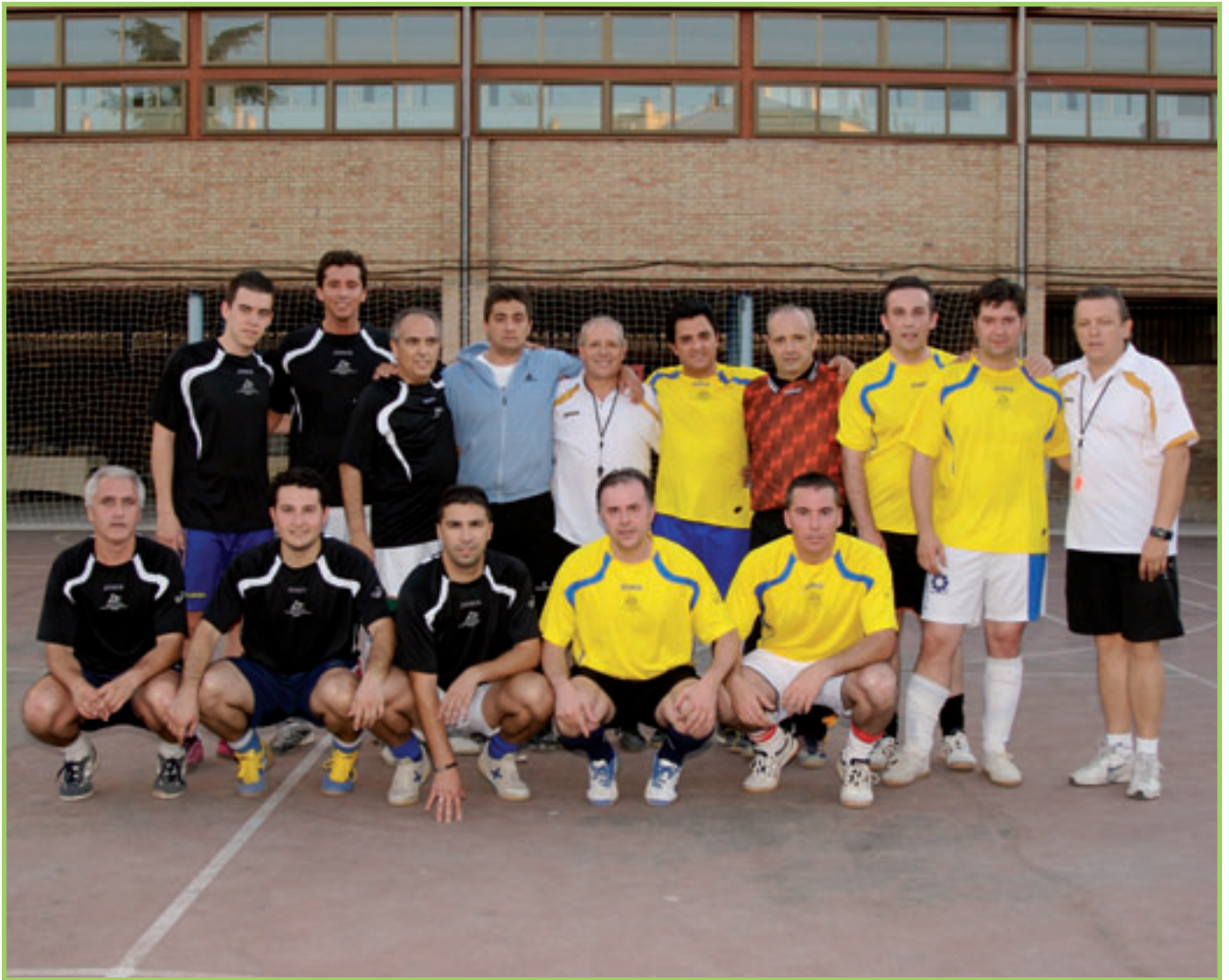
Equipos Finalistas Trofeo CORPUS Futbol Sala