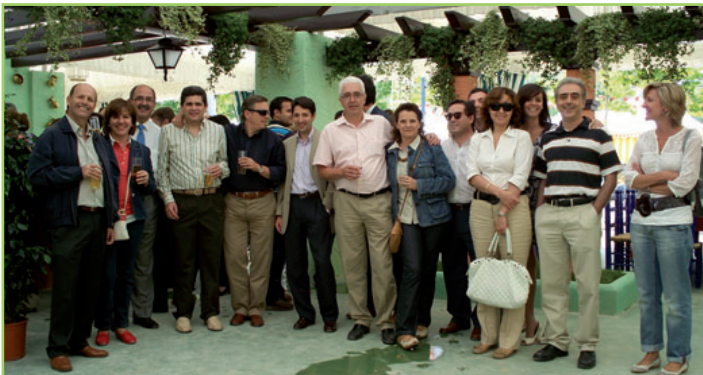
Control Operativo de Pagos. Asistentes Caseta. Comida del Lunes. Servicios Centrales.