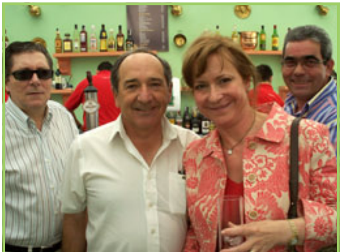
Unidad Atención al Cliente y otros