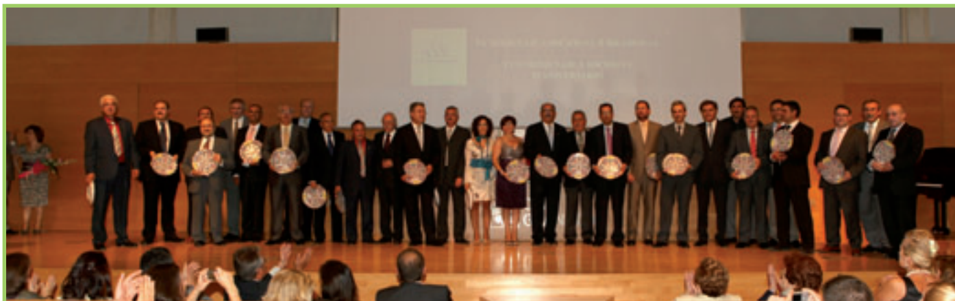
Homenajeados 25 Aniversario