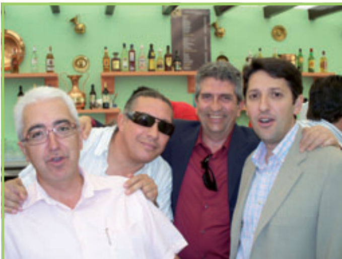
Compañeros Contabilidad y Control.