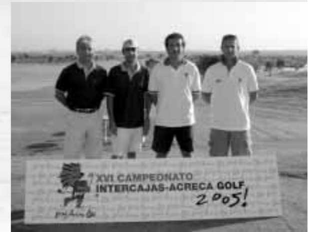
Cajasur, otra pareja de la Asociación clasificada en tercer lugar