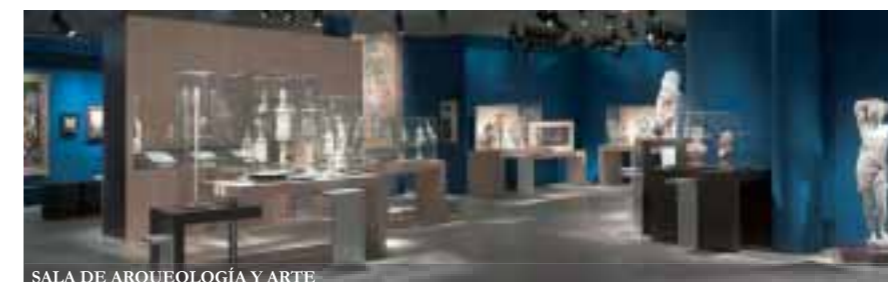
SALA DE ARQUEOLOGÍA Y ARTE

En la penumbra de la bodega, en tinos y barricas de roble francés y americano, descansa solamente el vino de las mejores añadas, adquiriendo los matices nobles del roble y resaltando los que le son propios al vino. El resultado es un vino inimitablemente personal, complejo y elegante en sensaciones.