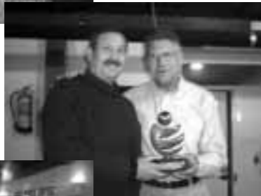
Recuerdo a la Asoc. Sagrada Familia