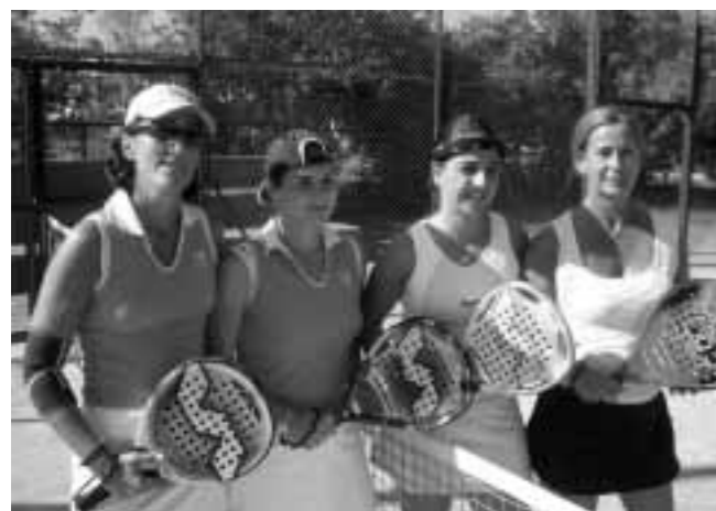
Final DAD Kuxta - Hermandad Sagrada Familia Cajasur

En esta Edición se han presentado 17 Asociaciones, inscribiendo 18 equipos en la modalidad masculina y 13 equipos en la modalidad femenina, con un total de 198 personas inscritas.