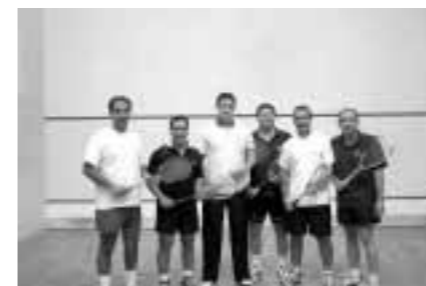
Asoc. Sagrada Familia Caja Granada

Durante tres días (19-21 de mayo de 2005) se ha celebrado en la ciudad de Murcia el Campeonato ACRECA de Squash, reuniéndose en nuestra ciudad para tal evento las asociaciones de empleados de las cajas de Granada, Zaragoza, Canarias, BBK y CAJAMURCIA que en esta ocasión actuaba como anfitriona.