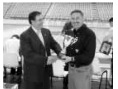
Tercer clasificado Agrupació Caixa Tarragona