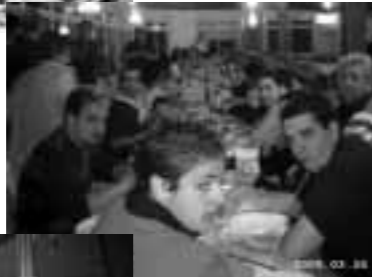
Aspecto Cena Clausura