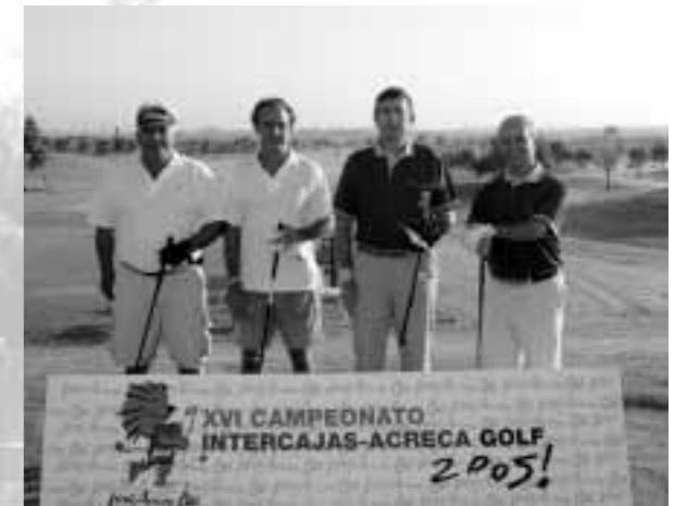
Cajasur, una pareja de la Asociación clasificada en tercer lugar