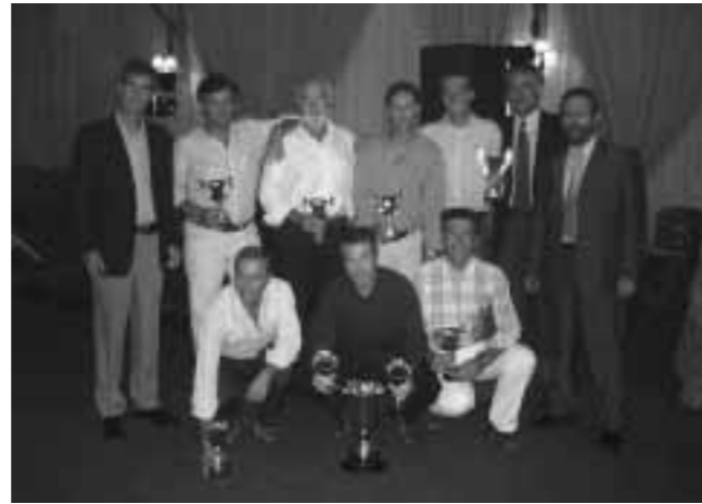
Hermandad Cajasur Campeones

El Grupo de Empresa Sagrada Familia de Caja San Fernando ha organizado este año 2005 la VII edición del CAMPEONATO ACRECA INTERCAJAS DE PADEL, habiéndose celebrado del 20 al 24 de septiembre en la localidad de El Puerto de Santa María en la provincia de Cádiz.