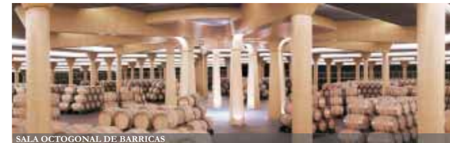
SALA OCTOGONAL DE BARRICAS

Cuatro generaciones de tradición vitivinícola han permitido a la familia Vivanco hacer realidad el sueño de toda una vida: Viñedos, Bodega, Fundación y Museo de la Cultura del Vino. Los viñedos que posee la familia, más de 400 hectáreas, se extienden principalmente por los municipios de Briones y Haro. Los diferentes pagos, con características de microclima y suelo propias, dan carácter y expresión a los vinos más sobresalientes de la casa.