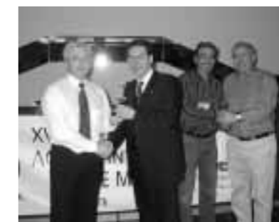
Consolación A - Caja Vital