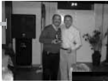
Recuerdo a Caja Granada