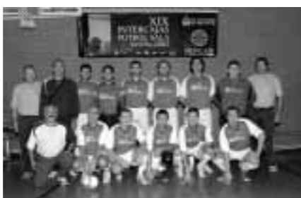
Granada, tercer clasificado