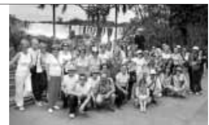
Viaje Argentina 2005. Cataratas de Iguazú

72 compañeros de varias de nuestras Asociaciones recorrieron el pasado diciembre la inmensidad de la Pampa Argentina, sus glaciares, cataratas..., creando entre los participantes, algunos ya se conocían de años anteriores una buena relación de amistad y compañerismo.