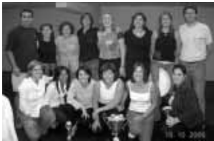
Sabadell femenino, equipo campeón