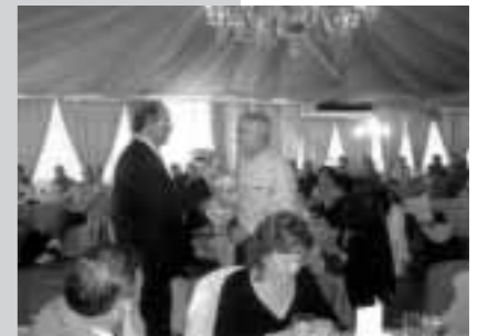
Entrega de premios