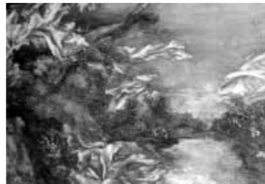
- Río subterráneo -

- Una pregunta que le harías a tú pintor favorito (bueno, y el nombre de ese pintor...)