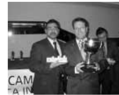
Campeones Grupo Empresa Caja Ávila