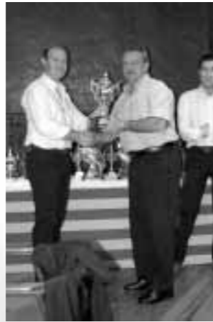
Trofeo para la A.R.E. CCM Cuenca

Y para finalizar, los participantes de CCM se ofrecieron para organizar la próxima edición y en caso de imposibilidad de escenarios, los extremeños serán los encargados de realizarla.