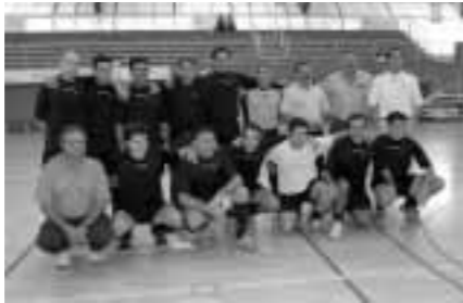
CAM, equipo campeón

El torneo femenino también se caracterizó por la máxima igualdad pues el triunfo en el campeonato obtenido por Caixa Sabadell se logró por mayor diferencia de goles que el equipo de Sa Nostra, sub-