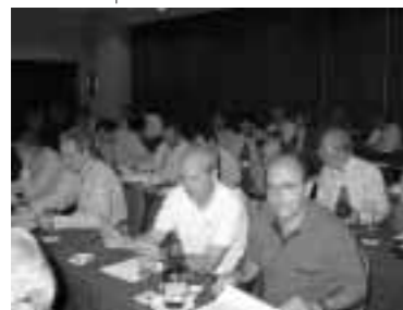
Asistentes Ponencia Deportes