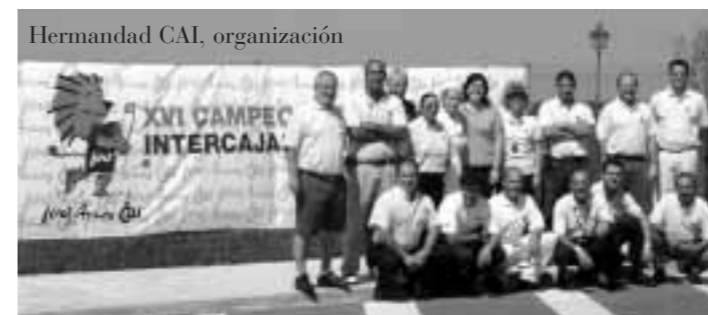
Hermandad CAI, organización