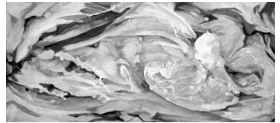
- Laberinto para Alicia -

- He visto muchos de tus cuadros expuestos en internet, e invito a los lectores que naveguen y se recreen también. Nos pue-