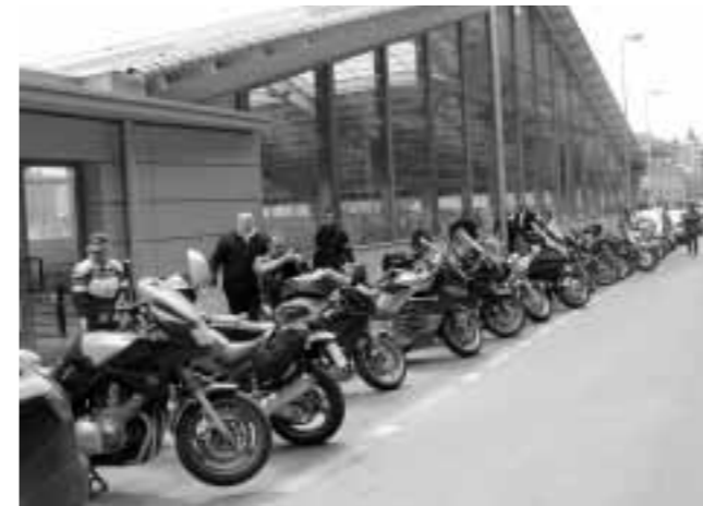
Preparando la salida