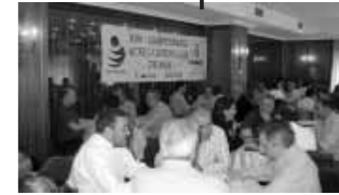
Salón de juego en León