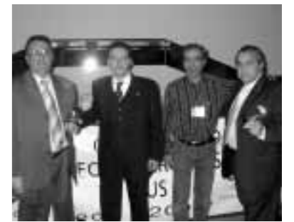
Pareja Subcampeona - CECA