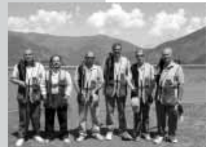
Granada. Terceros clasificados