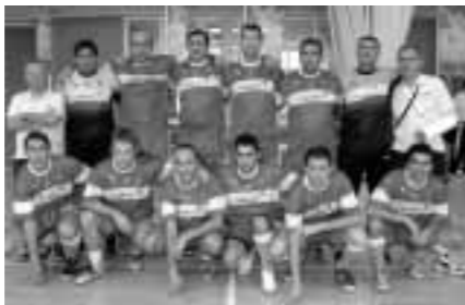
CajAstur, equipo subcampeón