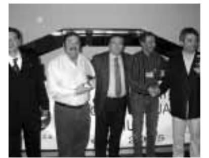
Tercera Pareja - Caja Segovia