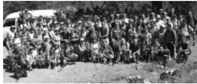
Un numeroso grupo de compañeros y amigos

Desde que Sa Nostra volvió a coger el testigo del Senderismo en ACRECA, y viendo la gran acogida que tuvo aquella concentración de 2002, los participantes de nuestra Asociación nos marcamos el objetivo de realizar la Organización del año 2005. Los dos años siguientes fueron maravillosos, Picos de Europa y Pirineos; donde pudimos observar y aprender de nuestros compañeros de Cantabria y CAI la dificultad que suponía organizar esta actividad, pero a su vez la gratificante sensación de poder disfrutar, enseñar y compartir parte de la tierra, gastronomía y cultura que más queremos y donde nos ha tocado vivir.