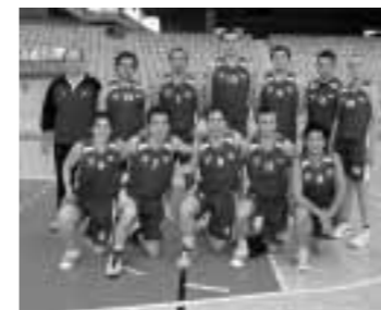
Finalista D.A.D. Kutxa

Y el año que viene nos espera el Mediterráneo, con Sitges como sede y con la Associació Sant Jordi de Caixa Penedès como anfitriones.