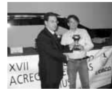
Terceros Clasificado Grupo Empresa Caja Segovia