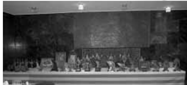
Una buena mesa de trofeos

La Concentración ACRECA Intercajas de Pesca en Agua Dulce fue organizada por la Hermandad de Empleados de la CAI que nos presentó las dos modalidades Ciprínidos que celebró su decimosexta edición y salmónidos en su cuarta edición. Las fechas para su celebración fueron del 16 al 18 de septiembre y la cita acudieron 31 participantes pertenecientes a 6 Asociaciones.