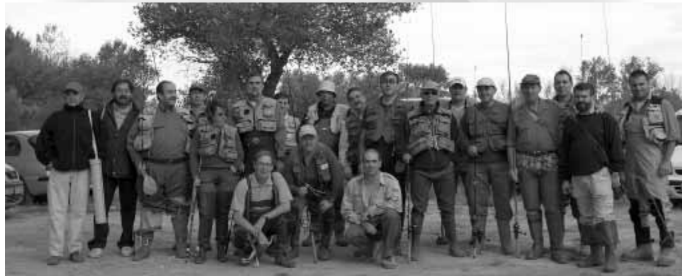
Foto de familia