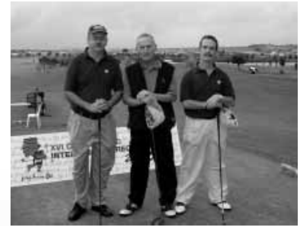
Tarrassa, una pareja de la Asociación Campeona

Según manifestaciones de bastantes jugadores la forma de hacer los grupos y las salidas por dos hoyos, ha mejorado el ritmo de juego de años anteriores, ya que los jugadores han jugado en un tiempo cercano a las 5 horas. Este detalle debería tenerse en cuenta para el futuro, así como contar con un comité de prueba dedicado exclusivamente al desarrollo de la misma.