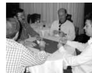
Tercer y cuarto puesto