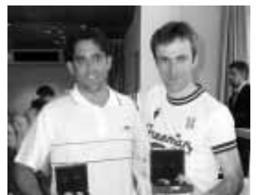
Segundos clasificados en triples