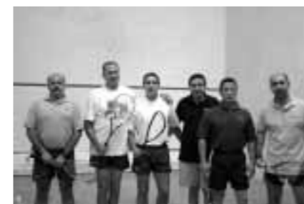
Asoc. Cultural y Recreativa de la BBK

Durante tres días (19-21 de mayo de 2005) se ha celebrado en la ciudad de Murcia el Campeonato ACRECA de Squash, reuniéndose en nuestra ciudad para tal evento las asociaciones de empleados de las cajas de Granada, Zaragoza, Canarias, BBK y CAJAMURCIA que en esta ocasión actuaba como anfitriona.