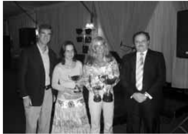
Campeonas Asoc. D.A.D. de la Kutxa