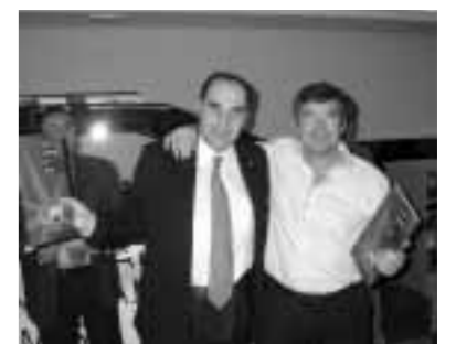
Consolación B - UCECA