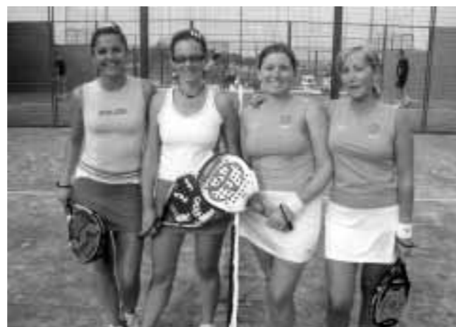
Cantabria - Club Moncase