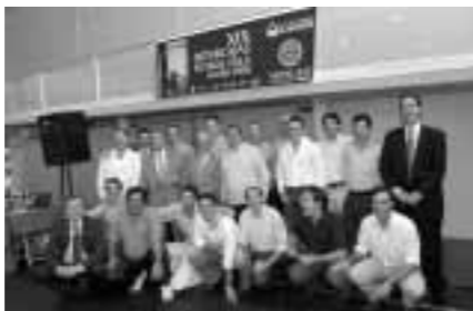
Estos chicos son buenos organizadores

campeón, al haber terminado en empate el encuentro entre ambos conjuntos.