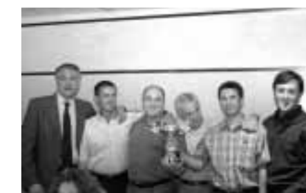
Buen papel de los anfitriones