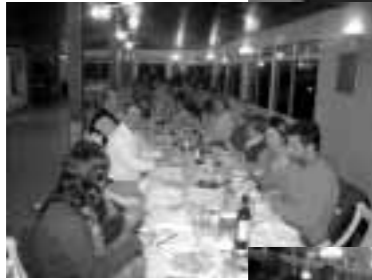
Amigos para siempre