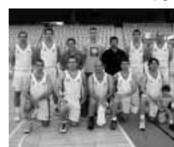
Finalista Agrupació Caixa Catalunya

Llegó el día de la final que permitió a la AGRUPACIÓ SANT JORDI DE CAIXA CATALUNYA alzarse con el título del 2005 en una complicada final ante la ASOCIACIÓN D.A.D. DE LA KUTXA , que meritoriamente tenía entre sus jugadores a 3 chicas que en todo momento dieron la cara, digno finalista.