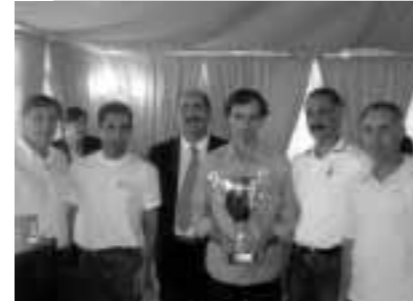
Equipo Campeón - Ureca Caixanova

Recoger el testigo organizador de este Campeonato Acreca Intercajas de Media Maratón, representaba un reto importante. Estamos acostumbrados a colaborar con la Federación, pero esta prueba creemos que es especialmente difícil y no por ello, resultado espectacular y bella.