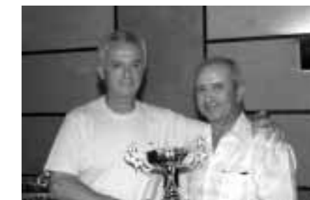
Tercer Clasificado C. S. Caja Murcia

tentes destacando la visita a las "termas cartaginesas" del hotel Entremares, así como la labor de guía que algunos de nuestros compañeros han realizado para los equipos durante sus estancias en Murcia. Mención especial al buen ambiente reinante durante la cena de clausura, celebrada en el restaurante Alfonso X de nuestra ciudad y en la entrega de trofeos que tuvo lugar a continuación.