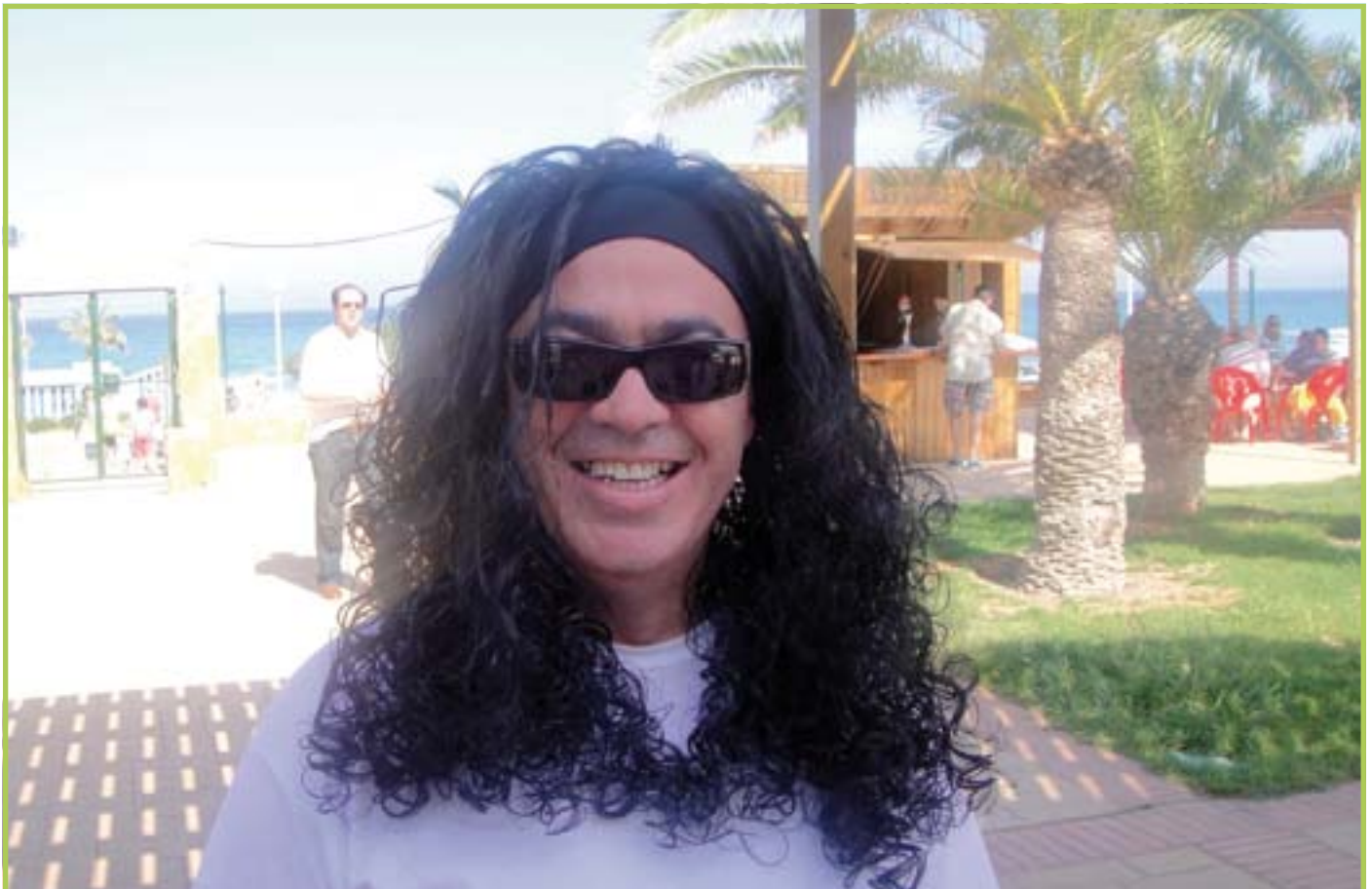
¿Quién soy? Yo también estuve en Mojácar