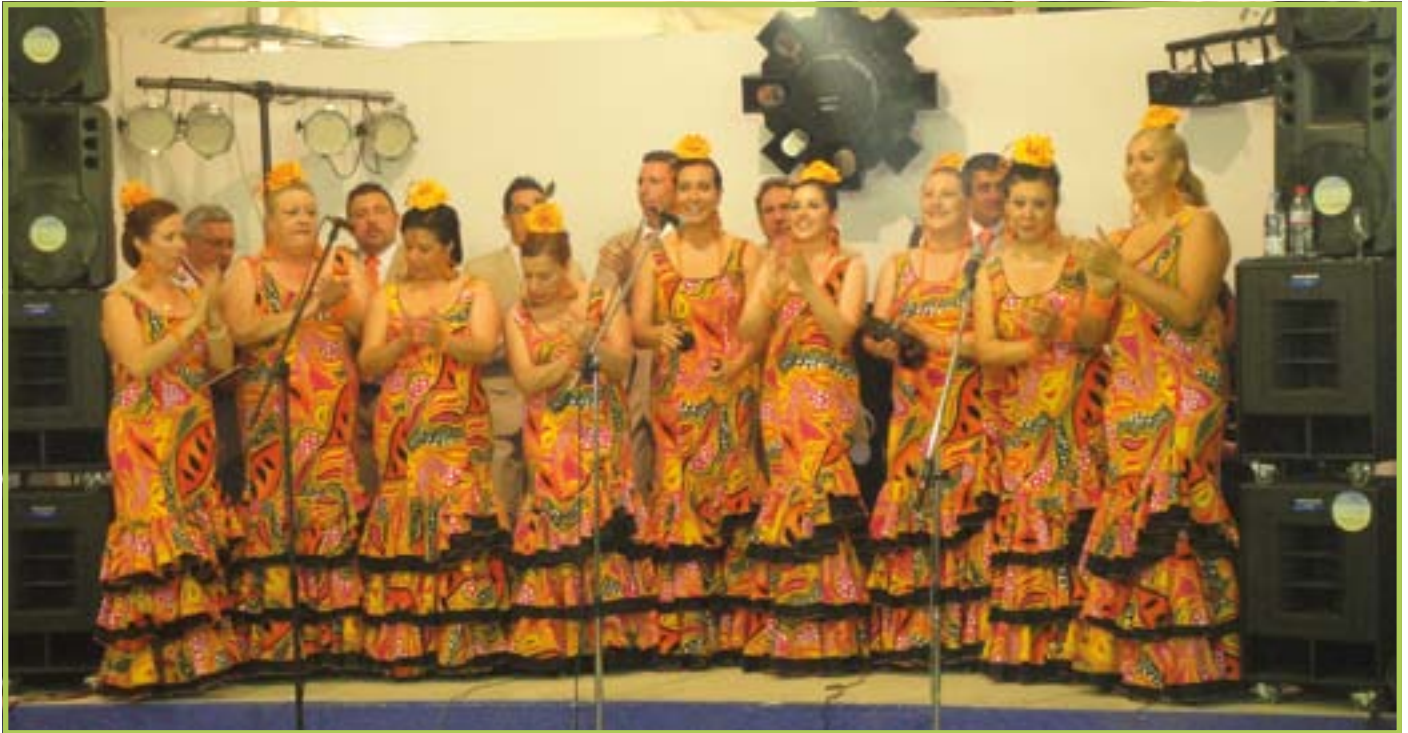
Día de la inauguración Coro Rociero Alcaicería