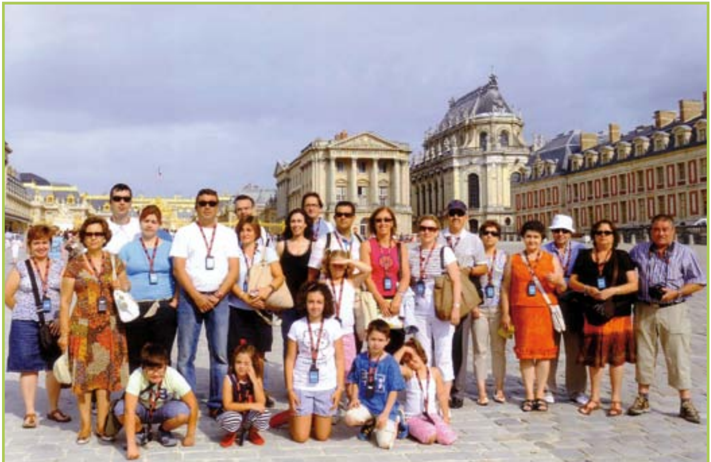
Chateau de Versailles