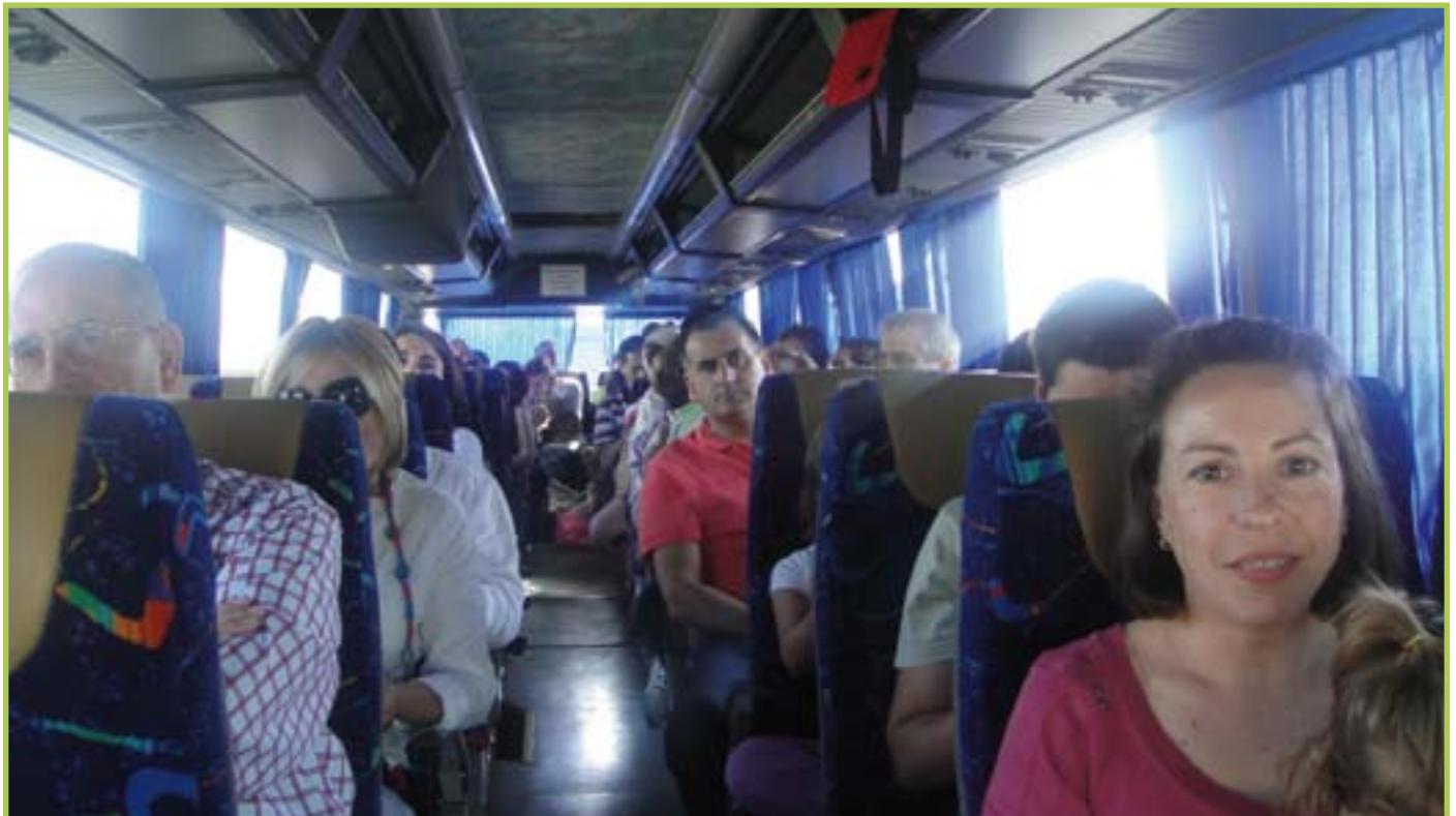
Viaje Fin de Semana en Mojácar