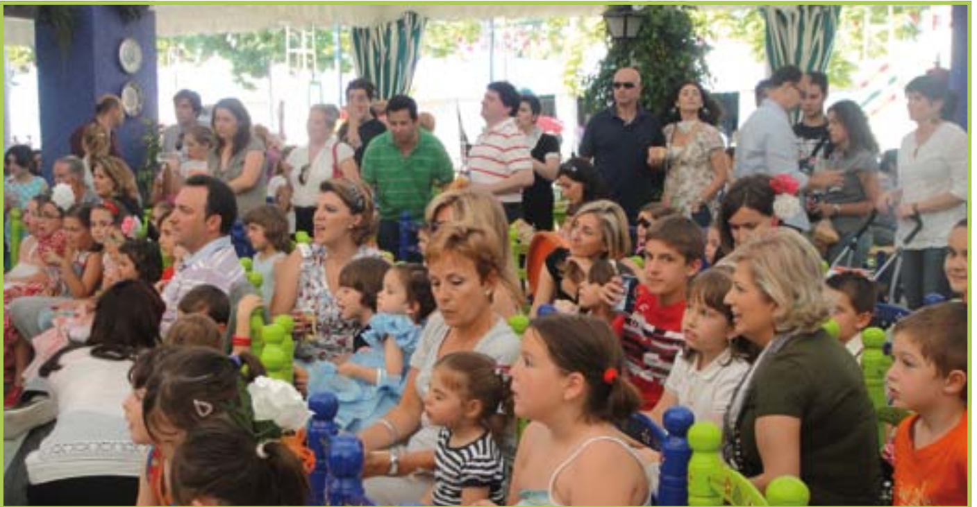
Fiesta infantil Caseta Corpus 2010