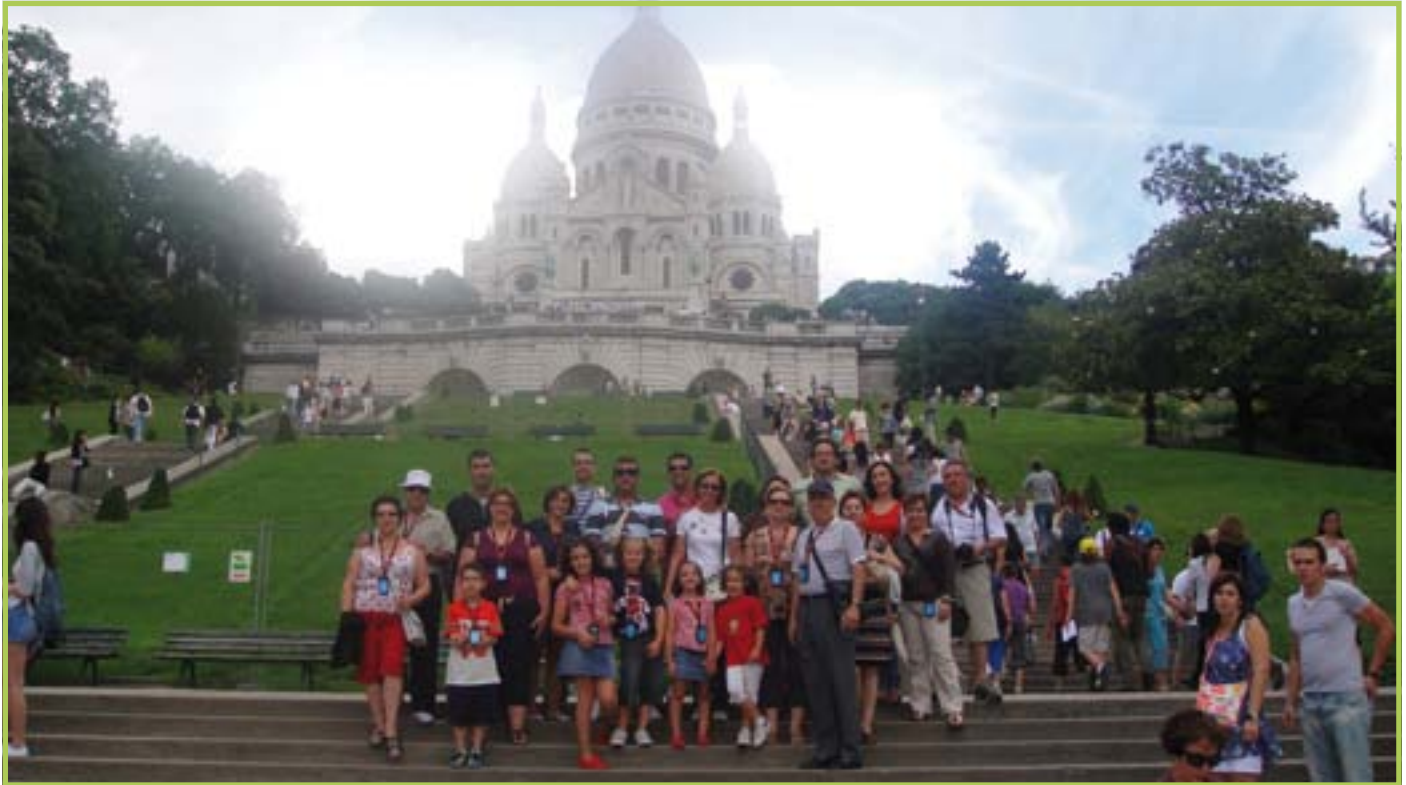
Basilica del Sagrado Corazón (Sacré Coeur, París)