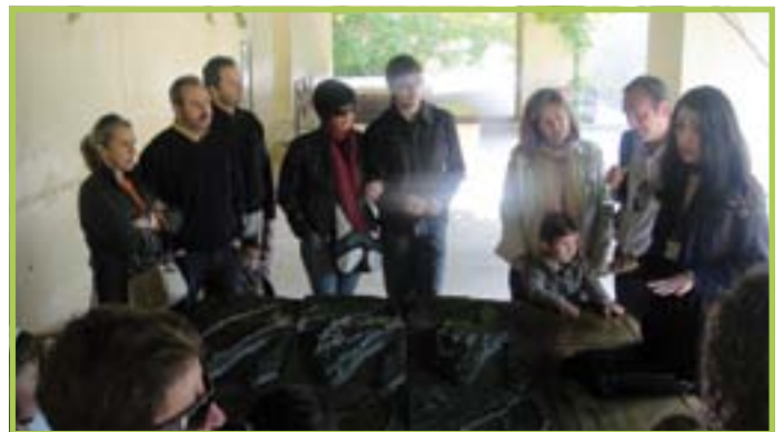
Más de 600 personas visitaron La Alhambra